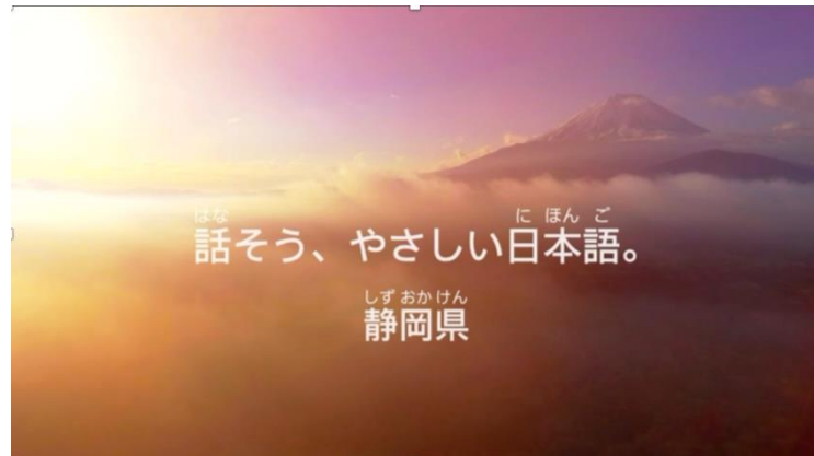
「話そう、やさしい日本語」 2020