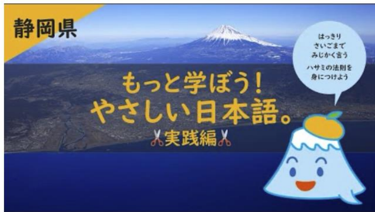
「もっと学ぼう！やさしい日本語」 2024