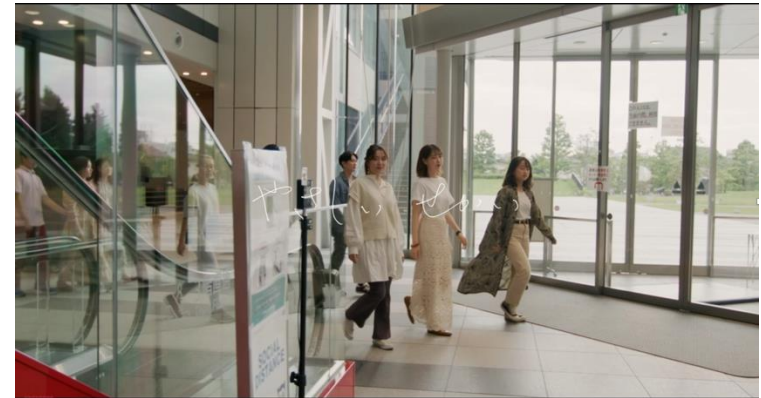
「やさしい せかい」 2021